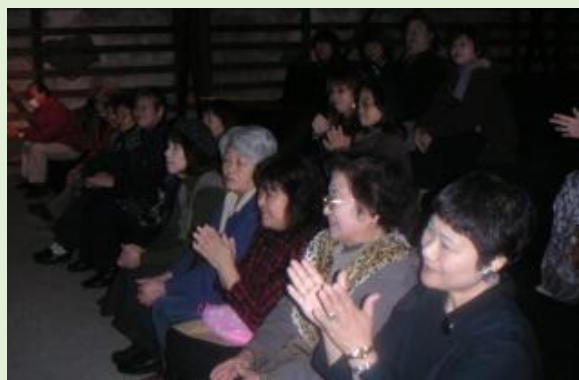
肩寄せ合って、みんなで お話の世界へ！