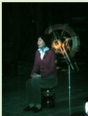
素敵な語り手 ステキなお話