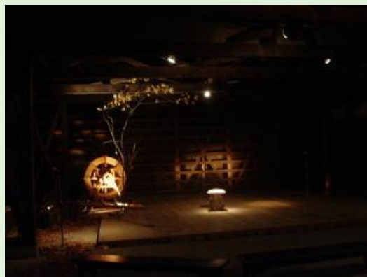
幻想的な雰囲気 of 会場